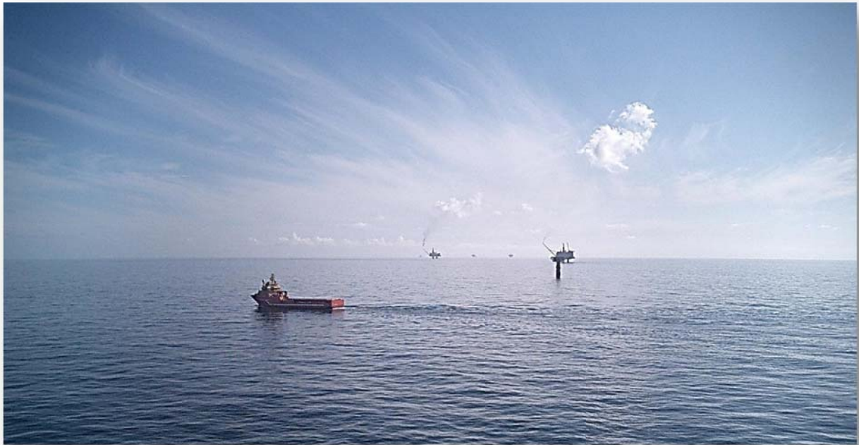
Viking Energy (Statfjord feltet)